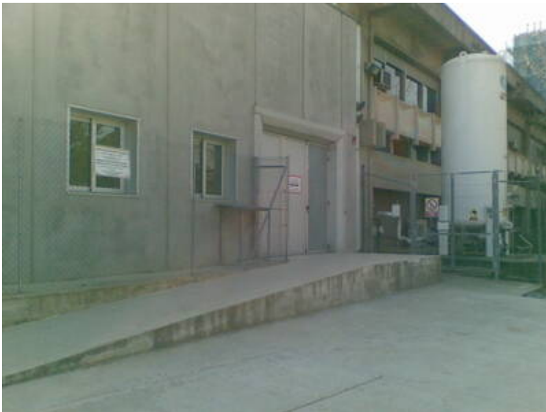
7 - Porta de manteniment del SeRMN. bla-bla-bla