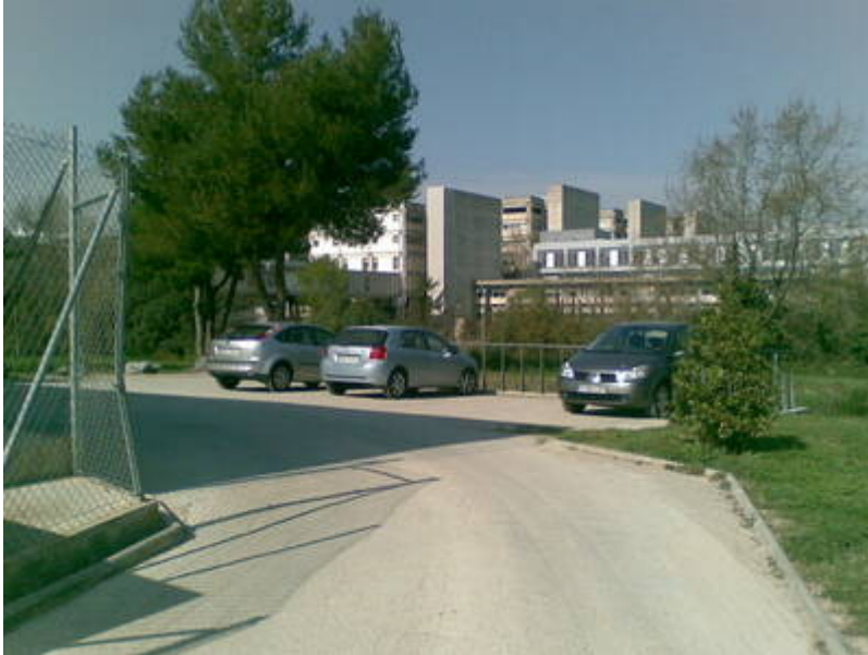
6 - Lloc per aparcar. bla-bla-bla